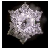
Photos de structures cristallines d'eaux sorties d'une chambre à vortex Vita Vortex.